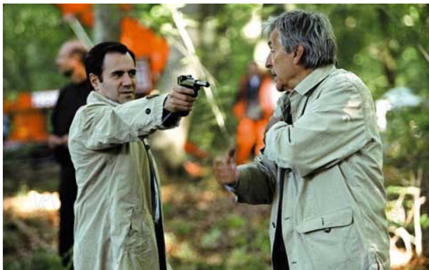
Σκηνοθεσία Κώστας Γαβράς, 2005, 122'

Ο Μπρούνο, οικογενειάρχης, στέλεχος μεγάλης πολυεθνικής εταιρείας, απολύεται ύστερα από 15 χρόνια υπηρεσίας λόγω περικοπών και επειδή η