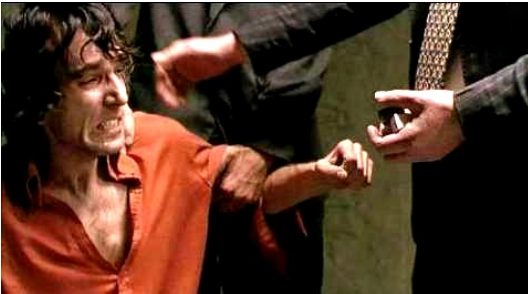
Σκηνοθεσία Τζιμ Σέρινταν, 1993, 128'

Μετά από μια βασανιστική ανάκριση, ένας νεαρός Ιρλανδός αποδέχεται τις άδικες κατηγορίες για συμμετοχή σε βομβιστική ενέργεια. Φυλακίζεται μαζί με τον πατέρα του. 15 χρόνια αργότερα μια δυναμική δικηγόρος μάχεται για τη δικαίωσή τους. Ο σκηνοθέτης αποσπά θαυμάσιες ερμηνείες από τους ηθοποιούς, παραθέτει τα γεγονότα με την ελάχιστη συναισθηματική φόρτιση.