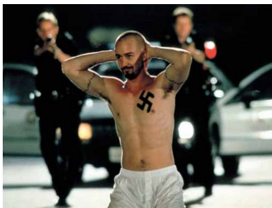
Σκηνοθεσία Τόνι Κέι, 1998, 115'

Ένας νεαρός νεοναζί σκοτώνει εν ψυχρώ δύο μαύρους που προσπάθησαν να κλέψουν το αυτοκίνητό