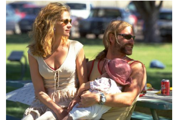
Σκηνοθεσία Στίβεν Σόντεμπεργκ, 2000, 133'

Η Έριν Μπρόκοβιτς είναι χωρισμένη και μητέρα τριών παιδιών. Αναζητεί δουλειά, και τελικά προσλαμβάνεται ως γραμματέας σε δικηγορικό γραφείο του Λος Άντζελες. Τακτοποιώντας το αρχείο, βρίσκει μια παλιά υπόθεση: κάτοικοι μικρής κοινότητας νιώθουν ότι αρρωσταίνουν από καρκίνο λόγω των αποβλήτων της επιχείρησης Pacific Gas & Electric — μια πραγματική ιστορία. Με προσωπικές και επίπονες προσπάθειες πείθει τους παραιτημένους κατοίκους να προσφύγουν στα δικαστήρια ζητώντας δικαίωση. Με από πολλές περιπέτειες της ίδιας και των κατοίκων τα δικαστήρια επιδικάζουν στην κοινότητα το υψηλότερο ποσό στη δικαστική ιστορία των ΗΠΑ, 333.000.000 δολάρια. Η μεγάλη εμπορική επιτυχία της ταινίας βασίστηκε τόσο στο σενάριο, όσο και στην ερμηνεία της Τζούλια Ρόμπερτς.