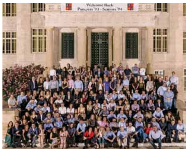
1993 γ 1994 Δ

□ Με μεγάλη συμμετοχή αποφοίτων πραγματοποιήθηκαν οι διοργανούμενες από το Κολλέγιο επετειακές Reunions των τάξεων 93γ-94Δ –25ετία (1 Ιουνίου, στο Κτίριο Αλεξάνδρα Μαρτίνου) και 1968 –50ετία (5 Ιουλίου, στην οικία του Διευθυντή/President).